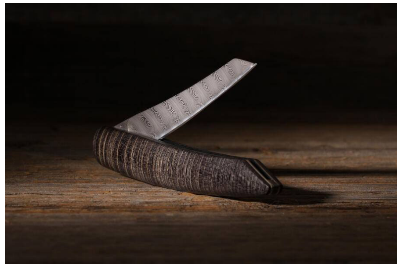
Das Taschenmesser ist auch mit Holzgriff erhältlich.

TECHNOLOGIE UND HANDWERK. Das Ergebnis sind faszinierende Messer, eine Mischung aus zeitgemässer Technologie, modernen Materialien und traditioneller Handwerkskunst. Beim Taschenmesser etwa kommt ein widerstandsloser Schliessmechanismus mit Keramik-Gleitlager zum Einsatz. Und während andere Damastmesser oft anfällig für Rost sind, verwenden die Profis bei Sknife einen hoch-korrosionsbeständigen Damaststahl. Dieser macht das Taschenmesser besonders langlebig und hinterlässt beim Gebrauch von Damast-Messer und -Gabel keinen metallischen Geschmack an den Händen.