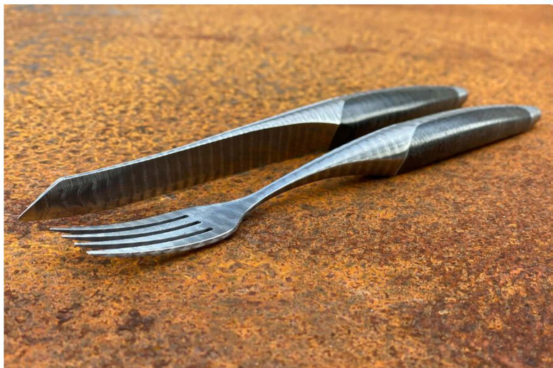
Damast-Besteck von Sknife liegt in den weltbesten Restaurants.