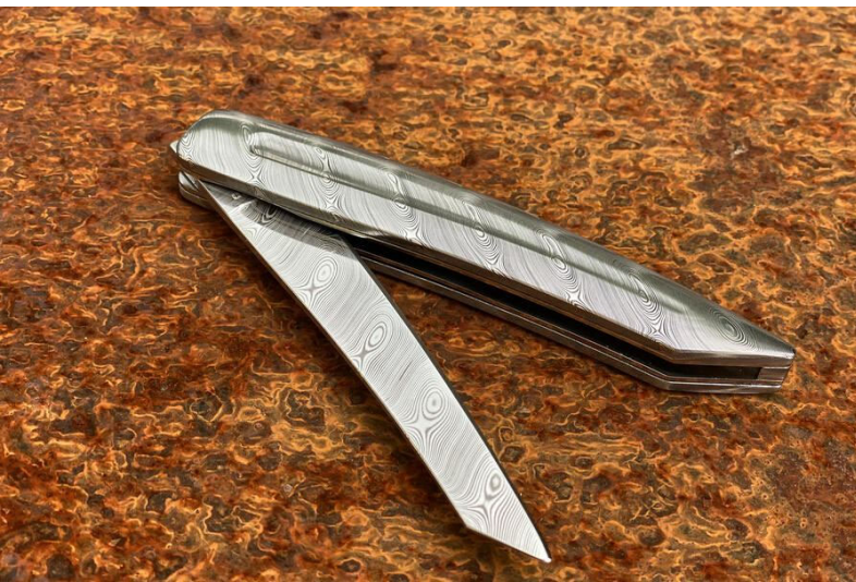
Weltweit einmalig: Taschenmesser von Sknife aus Volldamast.